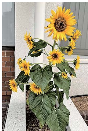
西部支所花壇に咲いたひまわり

高来支部では湯江駅構内の花壇へひまわりの種を植えました。今回は青年部の皆様にもご協力いただき、草で荒れていた湯江駅構内の花壇は見違えるほど綺麗になりました。