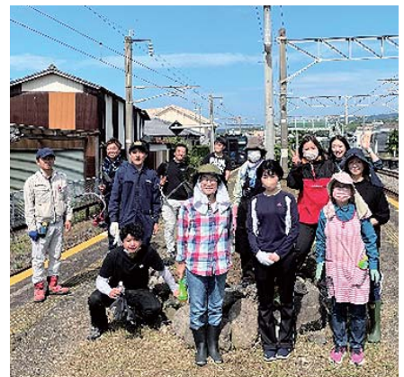
女性部高来支部と青年部高来支部 集合写真